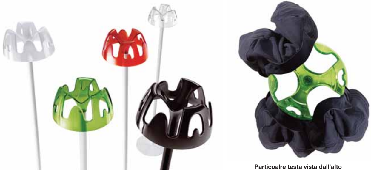
Particolare testa vista dall'alto