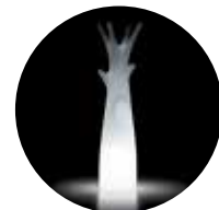
Versione light / Light version