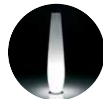
Versione light / Light version